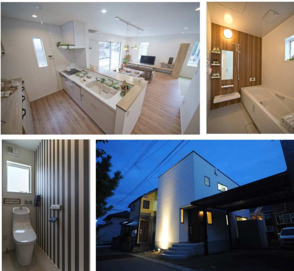
※建物未完成につき写真はイメージです

神奈川知事(4)第24181号 〒248-0015 神奈川県鎌倉市笹目町9-21