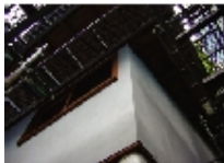
左官は群馬から！下地も「真っ平ら」に仕上げることわりです。