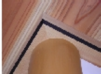
真壁天井廻縁、突き合わせの収まりは完璧！